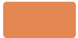
Sunflower S 280