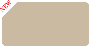
Honey Comb S 206