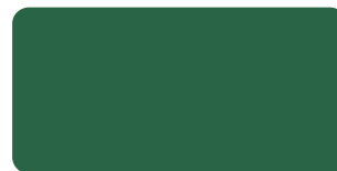
Bright Green S 290