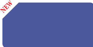
Moon Violet S 215