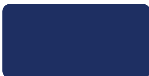
Midnight Blue S 298