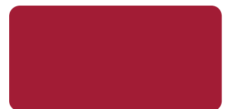
Sunrise S 211