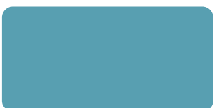
Bright Blue S 297