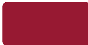
Signal Red S 200