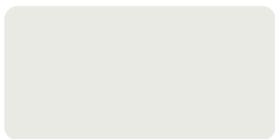
สีรองพื้นไม้กั้นเชื้อรา C 181