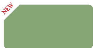
Apple Green S 213