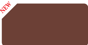
Burn Brown S 209