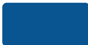
River Blue S 285