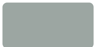
Platinum S 205