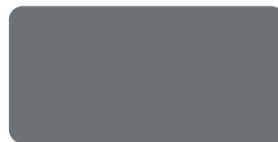
สีรองพื้นกันสนิมเทา T 140